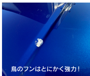
鳥のフンはとにかく強力!

車の塗装面にシミやクレターなどの深刻な影響を及ぼす要因としては、酸性雨や花粉、黄砂、融雪剤などの様々な酸性・アルカリ性の物質がありますが、それらの比にならないほど鳥のフンは強力で、付いた瞬間からすぐに影響